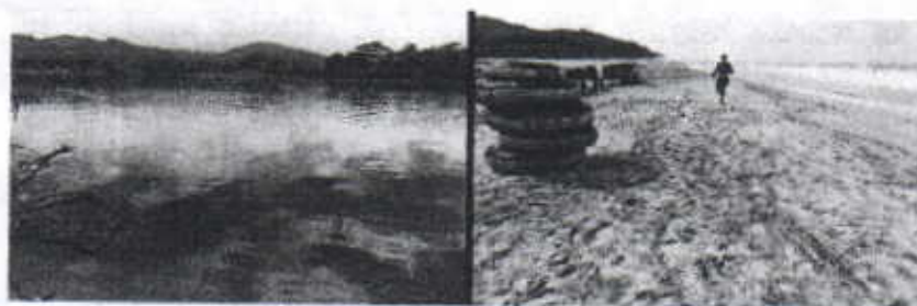
Desembocadura del río Palomino

También se puede observar la intervención de arboles y/o remoción de la vegetación que hacen parte de la franja protectora de río palomino, particularmente en la desembocadura.