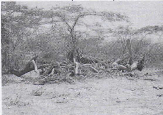
Bosque afectado por tala