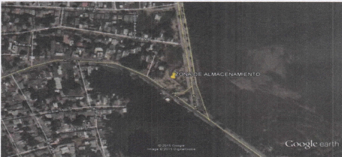
Figura. Zona donde actualmente se dispone y almacena material de construcción.

El proyecto en mención realiza actividad de disposición y almacenamiento temporal de materiales, en una zona de terreno localizada en las siguientes coordenadas: N 11°32'43" O 72°54'05". (Ver figura).