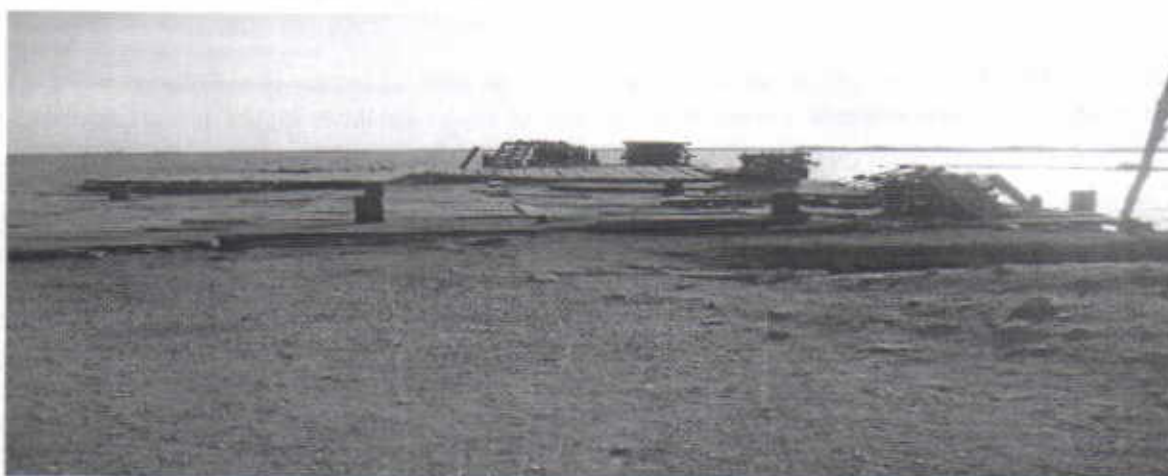
Ilustración del muelle de PENSOPÓRT S. A., el día 6 de febrero de 2015

La imagen muestra cómo se encontró el Puerto de la Asociación Portuaria de la Península S. A. (PENSOPORT S. A.), el día 6 de Febrero de 2015, es decir no había operación ni barcos en el muelle pero informaron que estaban a la espera del arribo de una embarcación que se observaba fondeada mar afuera en espera de la revisión de los guardacostas para la autorización de arribo o atracó al Puerto.