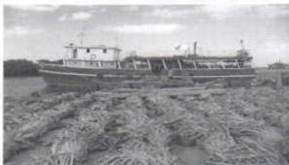
Evidencia del decomiso forestal realizado