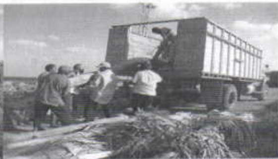
Recogiendo el decomiso en el muelle de PENSOPORT