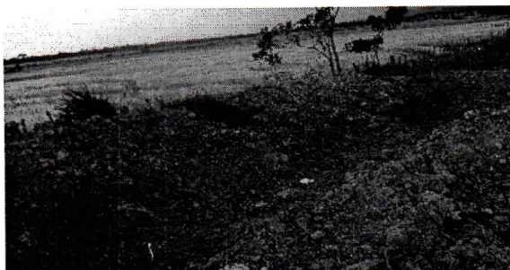
Fotografía No. 3 Estanque para trampa de peces