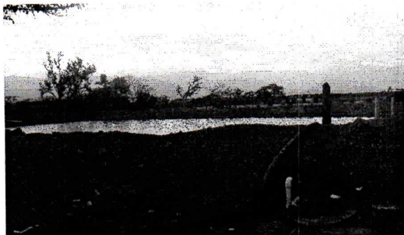
Fotografía No. 2 Estanque de cultivo

No tiene instalado el sistema de extracción (motobomba) hasta emprender el proyecto.