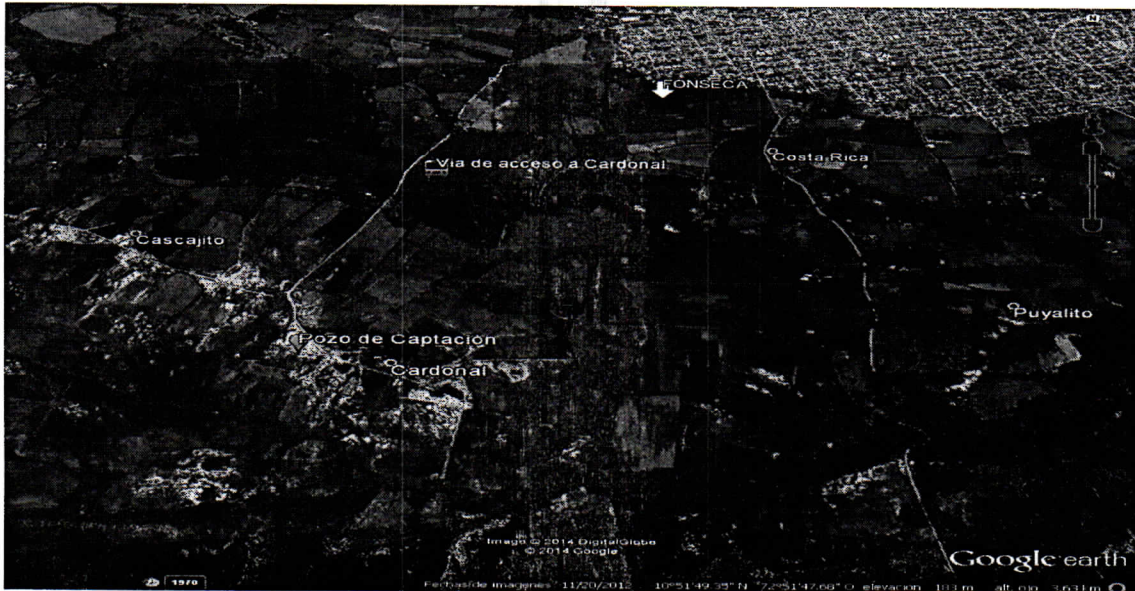
Imagen No. 1 Localización pozo de captación vereda Cardonal