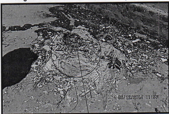
Fotografía No 3 Tocón con comején

En las fotografías 1,2,3 se aprecian en los tocones daños mecánicos causados por plagas (comején) y la mayoría de los árboles se encuentran afectados por problemas fitosanitarios, para lo cual se debe de controlar de inmediato estas infestación que se propaga a ritmo acelerado