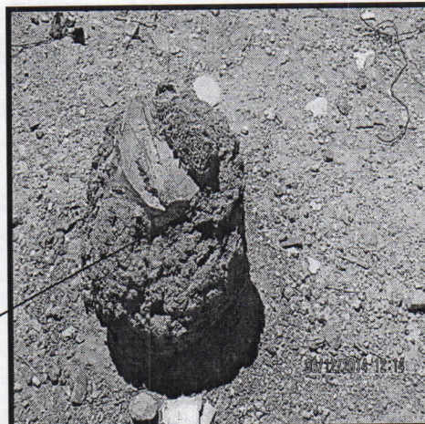
Fotografía No 2