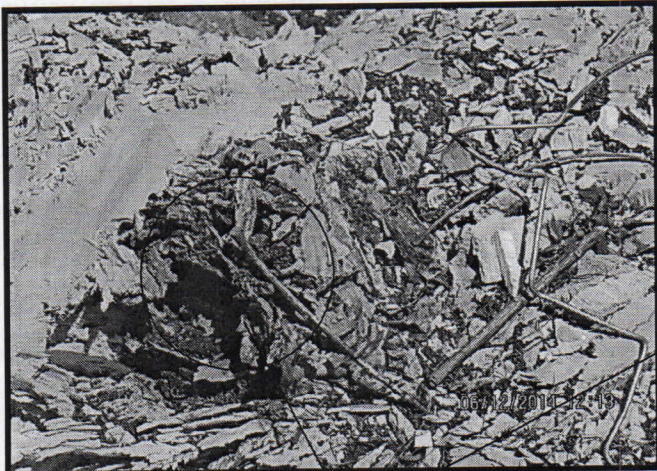
Fotografía No 1 Tocón con comején