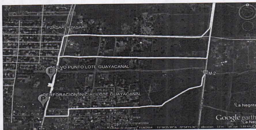
Figura No.1 Localización del Predio