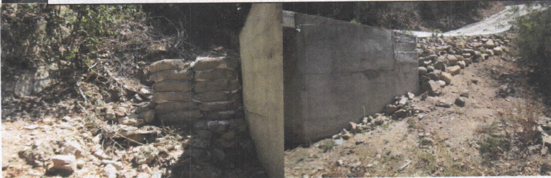
Margen izquierda a proteger por obras tipo gaviones- Manejo de agua a la obra