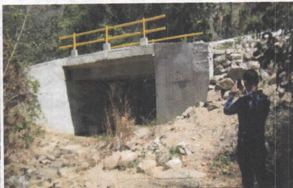
Acceso al puente sobre arroyo limoncito – Entrada al sitio de las obras de rectificación de cauce