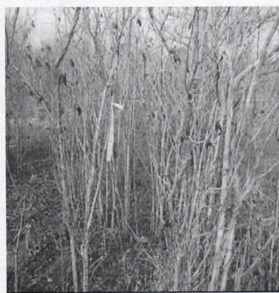
Parcelas de estudios correspondientes a la cobertura evaluada en el predio "Los caprichos"