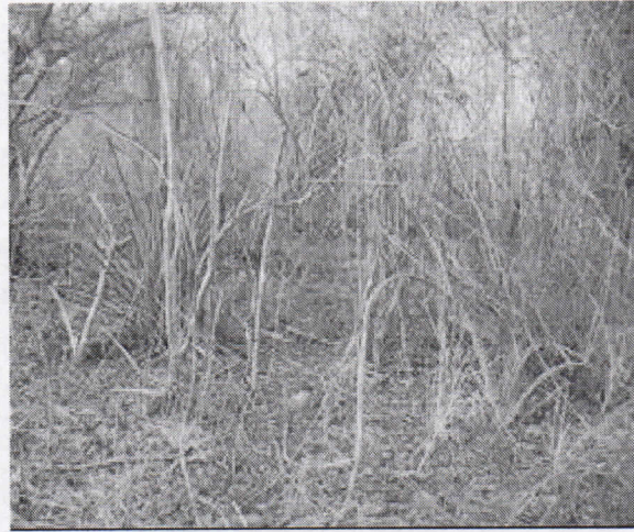
Cobertura de rastrojo bajo a intervenir en el predio "Los Caprichos"