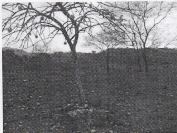
Arboles aislados correspondientes a la cobertura registrada al 100% para el predio "Los Caprichos"