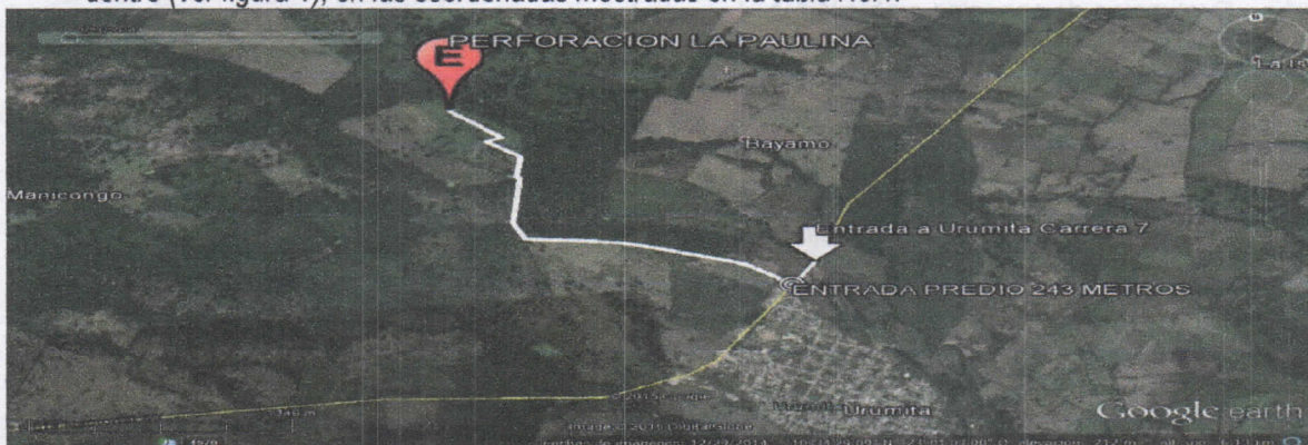
Figura No.1 Localización de la perforación en el Predio

El punto de perforación escogido se encuentra ubicado, en jurisdicción del municipio de Villanueva departamento de La Guajira, en el predio denominado La Paulina. Se llega al sitio por la vía que comunica al municipio de Villanueva con el de Urumita, cruzando a mano derecha a 243 metros después de pasar la primera entrada a la población de Urumita por la carrera 7, diagonal al vivero de CORPOGUAJIRA, a partir de allí, se recorren 3 kilómetro hacia dentro (ver figura 1), en las coordenadas mostradas en la tabla No. 1.