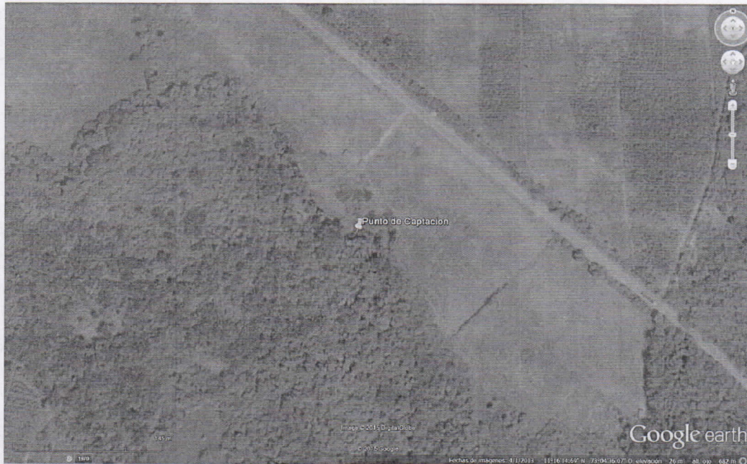
Imagen satelital 1. Ubicación geográfica del punto de captación, Predio la Esperanza.