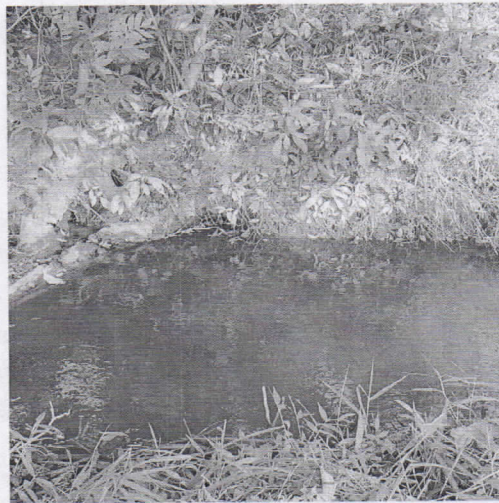
Imagen 2. Estado del canal en el punto visitado