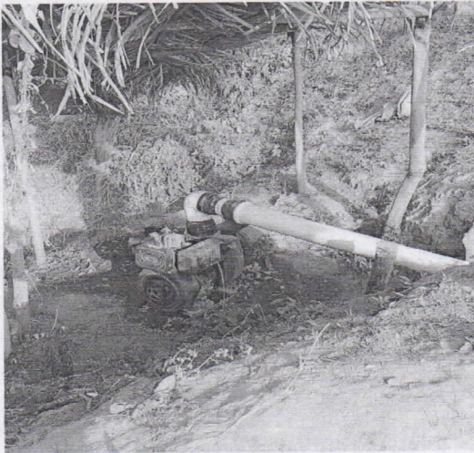
Imagen 1. Motor Bomba y Punto de captación Rudimentaria