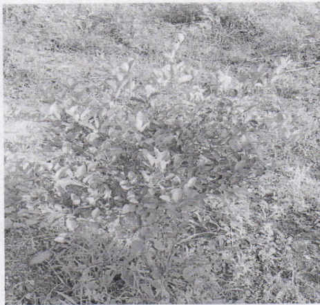
Imagen 3. Cultivo de Limón Criollo