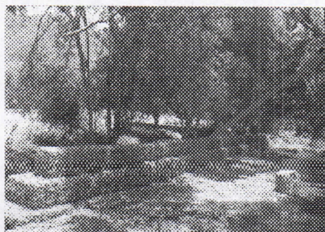
Estructuras de Gavión En la margen derecho del rio