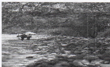
Acopio de rocas En la margen izquierdo del rio