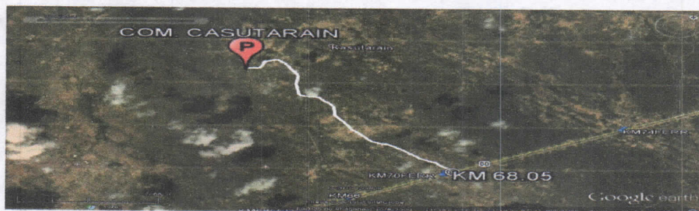
Figura No.1 Localización del Predio

El punto de perforación escogido se encuentra ubicado, en jurisdicción del municipio de Uribe departamento de La Guajira, en predios de la comunidad indígena de Casutarain. Se llega al sitio por la vía que conduce de cuatro vía a la cabecera principal del municipio de Uribe, Cruzando a mano izquierda en el kilómetro 68.05 de la vía, y el 70.18 de la vía férrea (ver figura 1), a partir de ahí se recorren 6.14 kilómetros hacia dentro, en las coordenadas mostradas en la Tabla No.1.