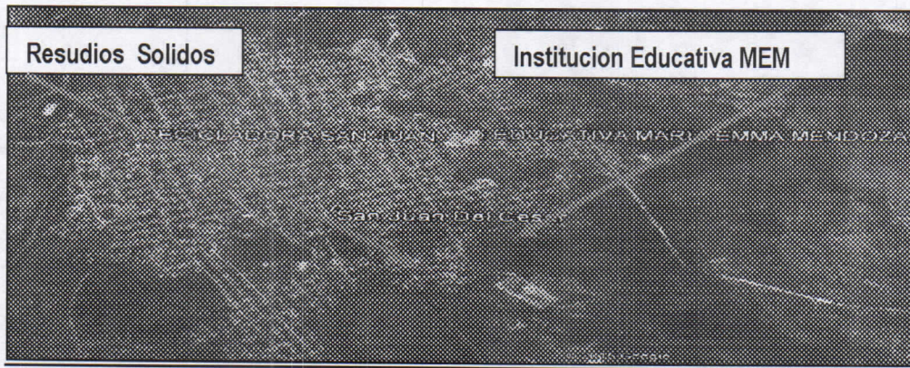
Área de la problemática de quema y disposición inadecuada de residuos sólidos, San Juan del Cesar