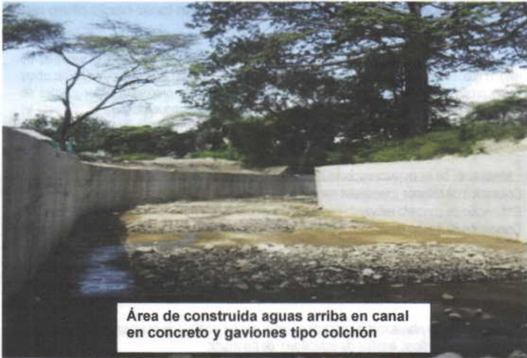
Área de construida aguas arriba en canal en concreto y gaviones tipo colchón