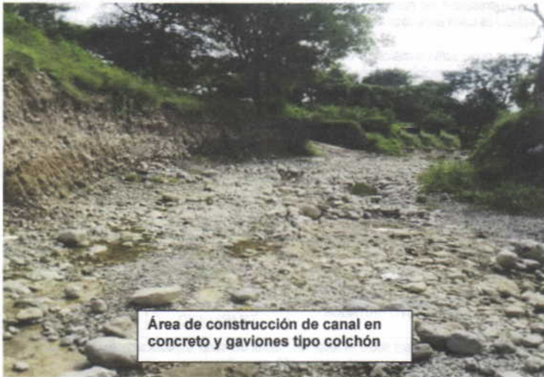
Área de construcción de canal en concreto y gaviones tipo colchón