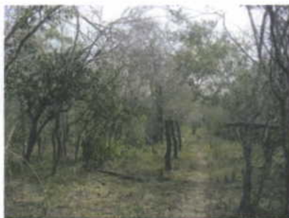
Area de cobertura mas densa (Rastrojo Alto)