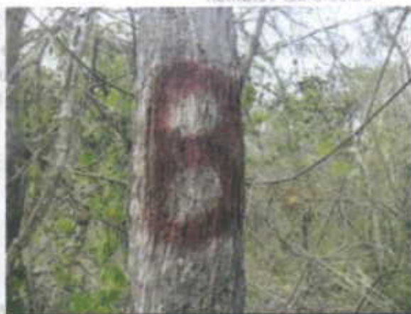
Especie Puy muestreada en el área