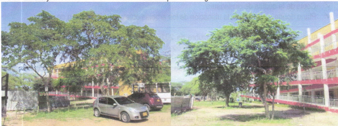
Guayacán ( Bulnesia arbórea )

Evidencia y ubicación de los árboles de Guayacán ( Bulnesia arbórea ) que requiere intervenir la Universidad de La Guajira debido a la Construcción del bloque de Postgrados.