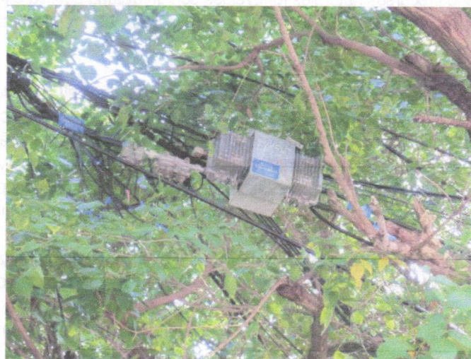
Redes y registro entrecruzado con las ramas

CONCEPTO. Basado en las observaciones descritas técnicamente se muestra la ubicación, condiciones fitosanitarias, desequilibrio por descompensación causado por vehículo en tiempos anteriores, inclinación hacia el interior del inmueble y desarrollo descontrolado que ha tenido la