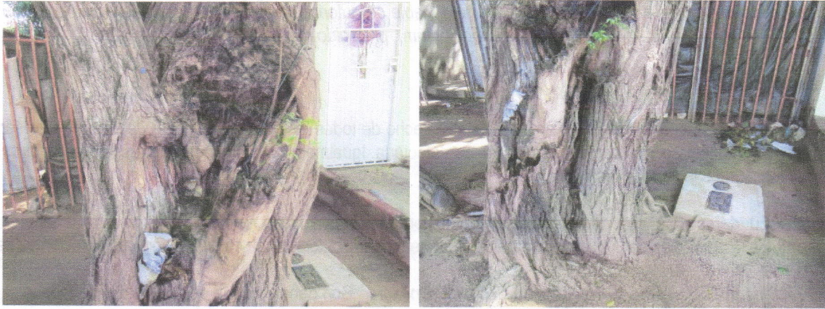
Evidencias de la afectación en el tallo del árbol de Corazónfino

"POR EL CUAL SE EFECTÚA UN LEVANTAMIENTO TEMPORAL DE VEDA DE UN ÁRBOL DE LA ESPECIE CORAZONFINO (PLATYMISCIUM PINNATUM) EN EL PREDIO UBICADO EN LA CALLE 13B N° 20-93 DEL DISTRITO DE RIOHACHA - LA GUAJIRA Y SE TOMAN OTRAS DETERMINACIONES"