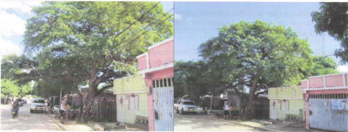
Se observa una inclinación pronunciada hacia el interior del inmueble